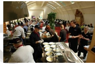
Offene Küche – front-cooking