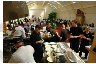
Offene Küche – front-cooking